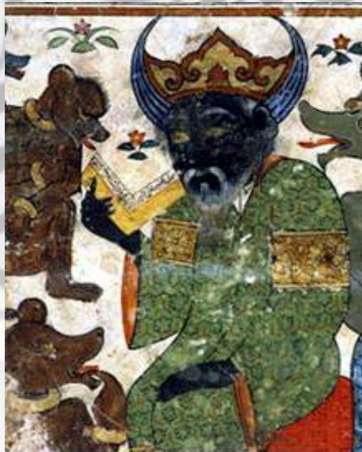
The Jin Iblis